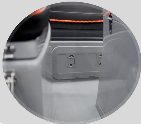
PORTILLOS LATERALES EN OPCIÓN