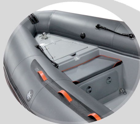
COLCHONETA OPCIONAL PROA WB-620