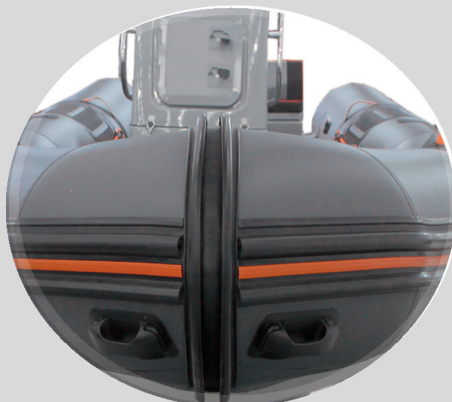
GUIA PASA-CABOS Y ASAS REFORZADAS PROA